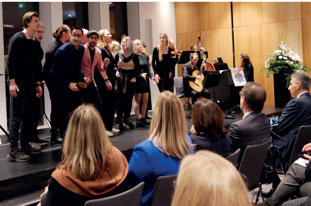
Mit den Einlagen der FAKS Giesing war die öffentliche Hauptveranstaltung abwechslungsreich gestaltet. Mehr dazu auf der Rückseite dieser Ausgabe.

gen kommen schnell, unvermutet und sind tiefgreifend. Die Aufgabe einer nachhaltigen Zukunftssicherung ist nur gemeinsam zu bewältigen.