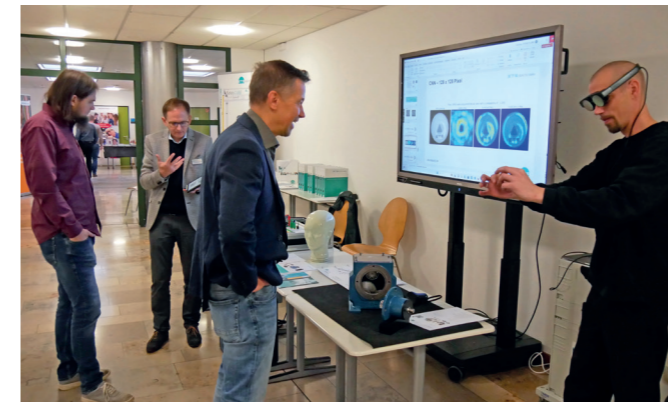
Auch die Lehrmittelaussteller zeigten sich zufrieden – hier beim Test eine VR-Brille.