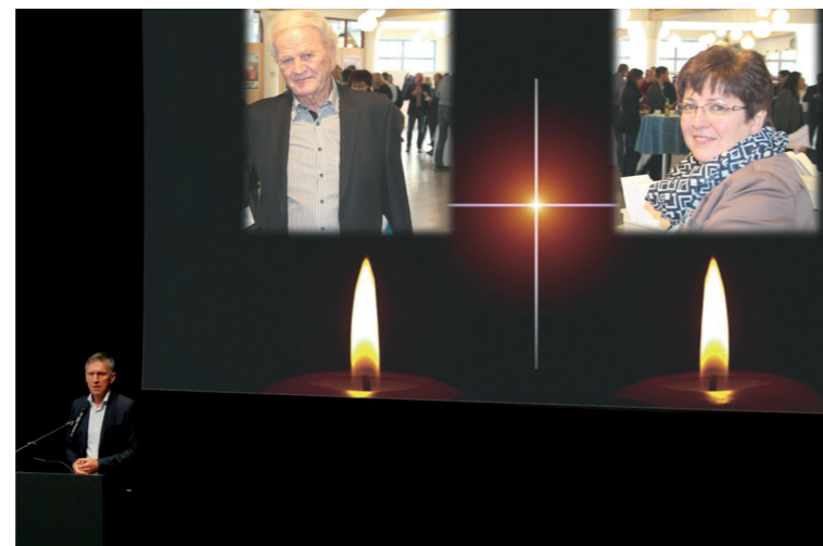
Die Delegierten gedenken ihren verstorbenen Kolleginnen und Kollegen.