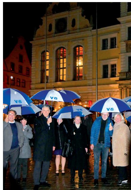
Gut beschirmt vor dem Ingolstädter Rathaus.

„Bayern ist Bildungsland – so heißt es gleich zu Beginn des aktuellen Koalitionsvertrages. Der Koalitionsvertrag will die Bildungspolitik der vergangenen Jahre weitgehend fortsetzen. Was uns Lehrkräften an beruflichen Schulen in Bayern fehlt – abgesehen davon, dass die berufliche Bildung in den fünf Seiten zur Bildungspolitik überhaupt nicht explizit erwähnt ist – ist eine Aufbruchstimmung vor dem Hintergrund der aktuellen Diskussionen um die weitere Aufwertung und Anerkennung der beruflichen Bildung, der Durchlässigkeit zwischen beruflicher und allgemeiner Bildung, dem Fach- und Lehrkräftemangel, neuen pädagogischen Konzepten wegen des gesellschaftlichen Wandels oder der Digitalisierung im Unterricht und der Schulverwaltung.“