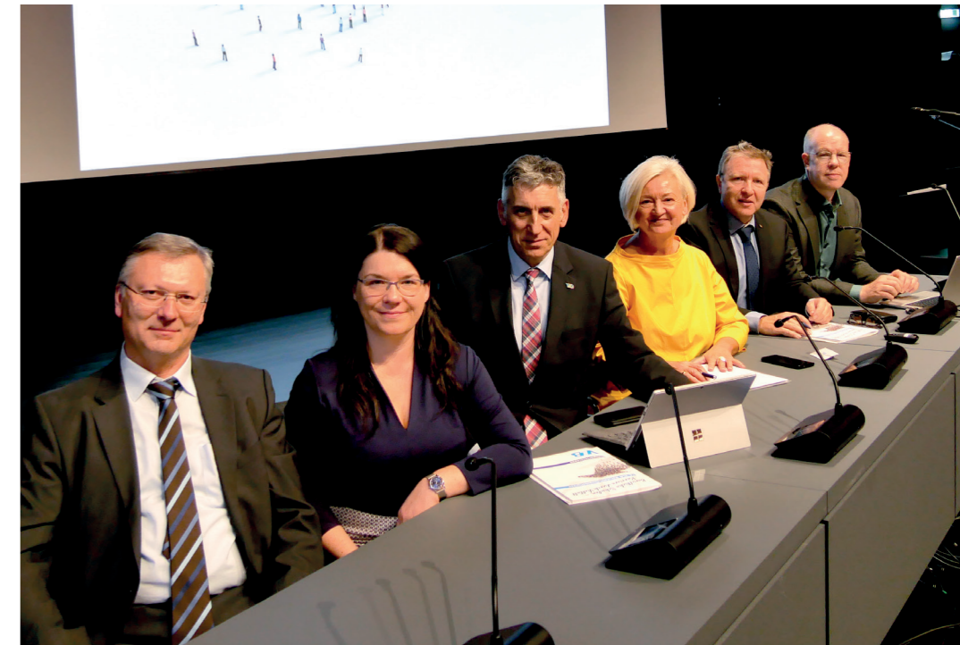
Der Geschäftsführende Vorstand erhielt Handlungsaufträge für die nächsten beiden Jahre.