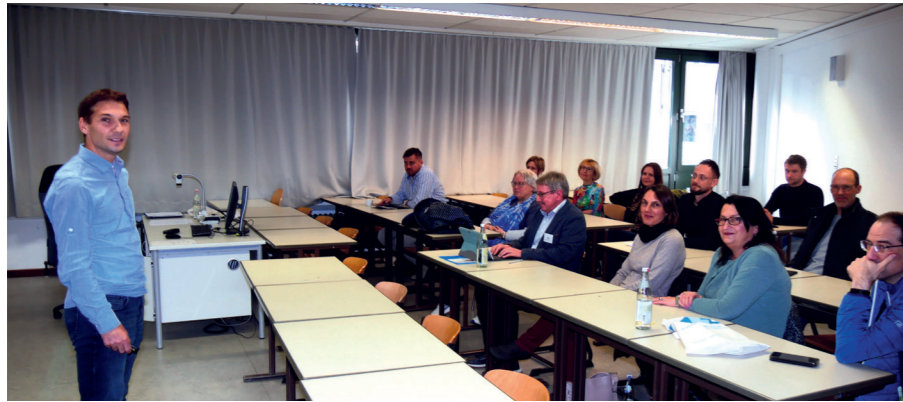
Mehrere Workshops widmeten sich unterschiedlichen Themenfeldern rund um FOSBOS. Exemplarisch im Bild: Workshop Seminarfach + Fachreferat.

Referenten im jeweiligen Thema auskennen. Ebenso können Literaturvorgaben gemacht werden, die von den SuS verarbeitet werden müssen. Darüber hinaus ist es wichtig, durch geeignete Maßnahmen einen Einblick in den Arbeitsprozess der Lernenden zu erlangen.