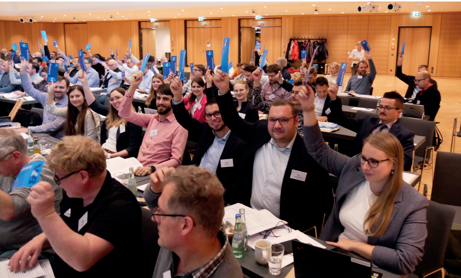
Der junge VLB zeigt „Stimmkarte“.