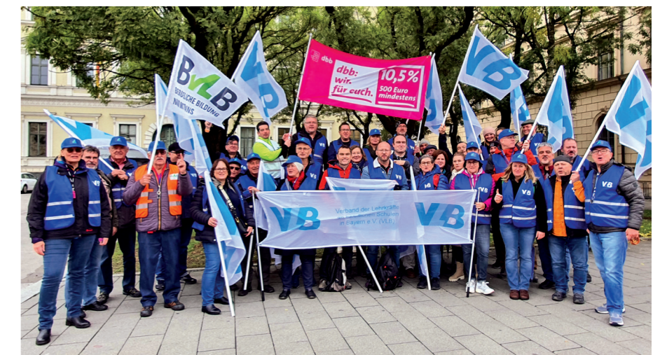
Bei den Mahnwachen des dbb sowie VLB-eigenen setzte der Verband Zeichen.

+++ Letzte Meldung: Sicher haben Sie aus der Presse und von anderer Seite vom Tarifabschluss zwei Wochen vor Weihnachten erfahren. Weitere Informationen erhalten Sie in der Folgeausgabe der VLB akzente. So viel vorab: Eine einzelne Tarifrunde kann die Versäumnisse der Vergangenheit nicht heilen und so sehen wir den Tarifabschluss als Kompromiss. +++