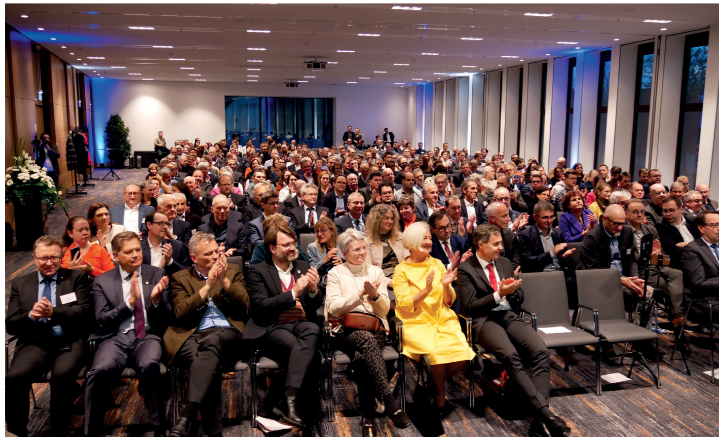
Applaus vom großen Auditorium der öffentlichen Hauptveranstaltung.

Großen Gestaltungswillen zeige die Stadt München im Beruflichen Bereich: So gebe es am Bogenhauser Kirchplatz ein eigenes Zentrum für die Berufsvorbereitung. In einer Pilotklasse wird der fachpraktische Unterrichtsanteil erhöht: Die Schülerinnen und Schüler können in städtischen Eigenbetrieben wie den Stadtwerken oder in der Stadtgärtnerei mitarbeiten und die Strukturen dort kennenlernen. Sie erlangen erste zertifizierte Grundfertigkeiten und sollen eine gehaltvolle Berufswahlkompetenz erreichen. Beim Übergang in die duale Ausbildung sollen sie außerdem passgenaue Anschlussperspektiven erhalten. Er betonte, die Landeshauptstadt München sei sich ihrer Verantwortung bewusst und stehe fest zu ihren beruflichen Schulen. Sie begegne dem Fachkräftemangel durch Werbung für das Lehramt an beruflichen Schulen und sei auf allen wichtigen Karriere- und Ausbildungsmessen vertreten. Die Schulen informieren zudem die Absolventinnen und Absolventen der allgemeinbildenden Schulen über das breite Angebot an Aus- und Weiterbildungen an den beruflichen Schulen.