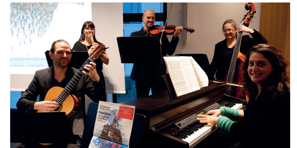
„Zusammenspiel“ war nicht nur bei den Musikern der FAKS Giesing angesagt.

Der Kongress aus Teilnehmersicht zusammengefasst: Das Motto „Berufliche Schulen – Karriere durch Vielfalt“ ist unbedingt zu ergänzen: VLB – Erfolgreich durch gekonntes, professionelles Zusammenspiel! //