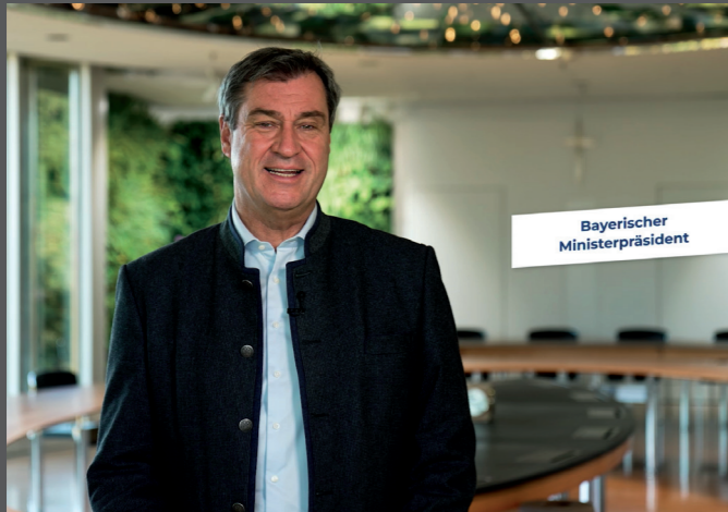
Dr. Markus Söder, Ministerpräsident (CSU)