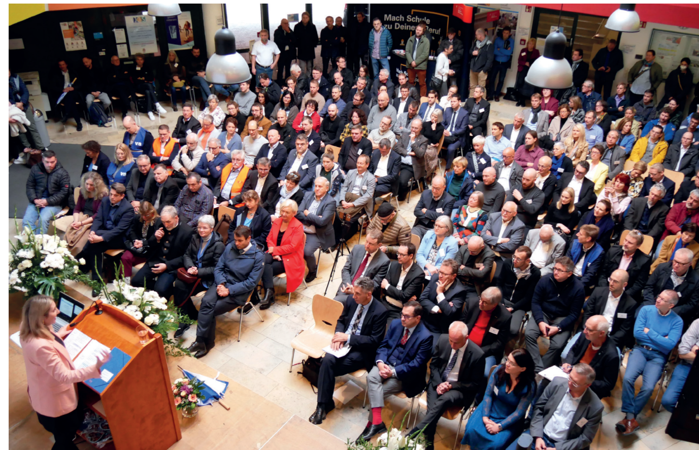
Die Kultusministerin Anna Stolz hielt eine fesselnde „Antrittsrede“ in den Reihen der Lehrkräfte beruflicher Schulen.