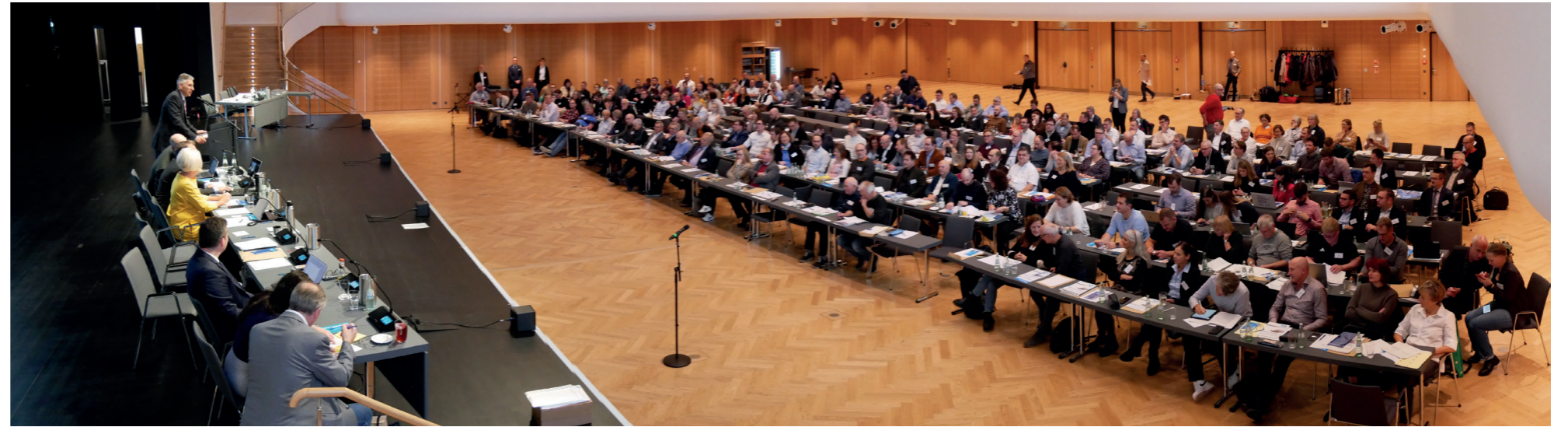
Die Delegierten im Congress Center Ingolstadt.