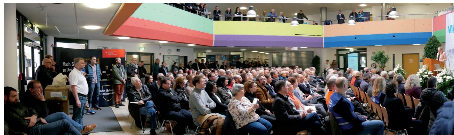
Etwa 800 interessierte Teilnehmer – ein Kongress der Rekorde.

Das Angebot war sehr facettenreich und bot für uns Lehrkräfte die Möglichkeit,