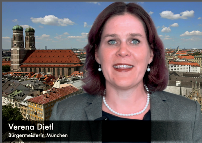
Verena Dietl, Bürgermeisterin München (SPD)