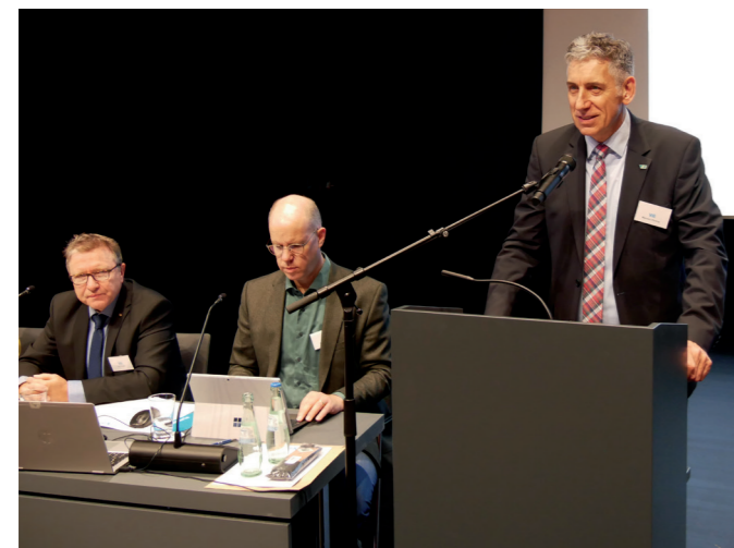
Unser Landesvorsitzender begrüßte die Anwesenden.