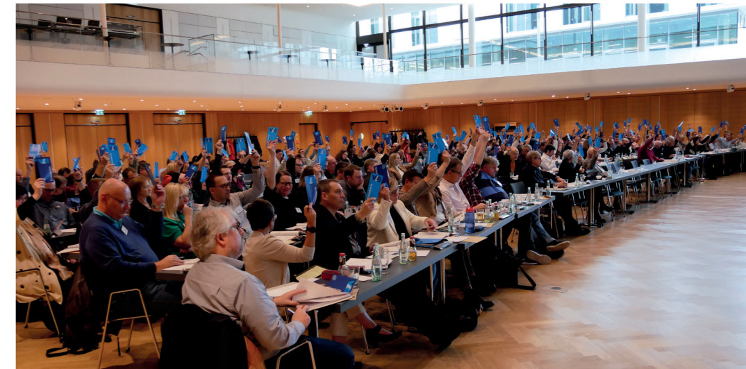
Große Einigkeit herrschte in vielen Punkten der Tagesordnung.