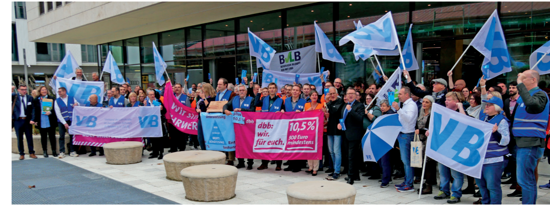
Die Delegierten „zeigten Flagge“ im Rahmen der Tarifverhandlungen.

Zuletzt wurde bekanntgegeben, dass der nächste VLB-Berufsbildungskongress im Herbst 2025 im schönen Unterfranken stattfinden soll. Den genauen Ort und Termin erfahren Sie natürlich in Ihrer VLB akzente . //