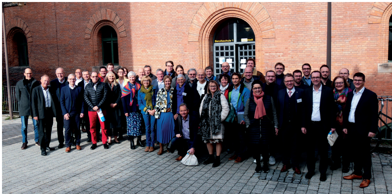
Die Lehrkräfte der beruflichen Oberschule waren in großer Zahl beim VLB-Berufsbildungskongress vertreten.