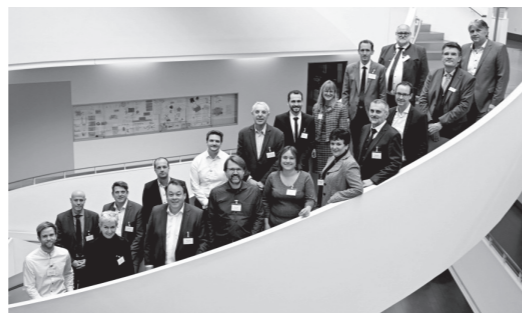
Die Vertreter/-innen des Kultusministeriums und der Kommunen, zu Gast am Städtischen Beruflichen Schulzentrum am Simon-Knoll-Platz.

Abgerundet wurde die Veranstaltung durch ein gemeinsames Essen, das von den Schüler/-innen der Städtischen Berufsschule für Hotel-, Gast- und Brauereiwesen exzellent zubereitet wurde und durch eine