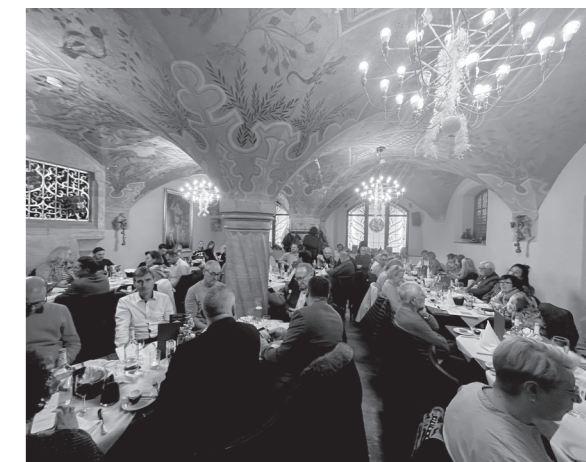
Volles Haus im Ratskeller. Der BV München lud zur Versammlung.

Das gewerblich-technische Berufsbildungszentrum auf der anderen Mainseite ist die ebenfalls städtische Josef-Greising-Schule. Sie wird nun von Martin