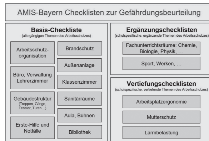
Abbildung 2: Struktur der von AMIS-Bayern entwickelten Checklisten zur GBU.

Die Nutzung der Checklisten im Prozess der GBU an der Schule dient auch als Basis für weitere gezielte Unterstützungsangebote von AMIS-Bayern. So können während der Bearbeitung aufkommende Fragestellungen Ausgangspunkt