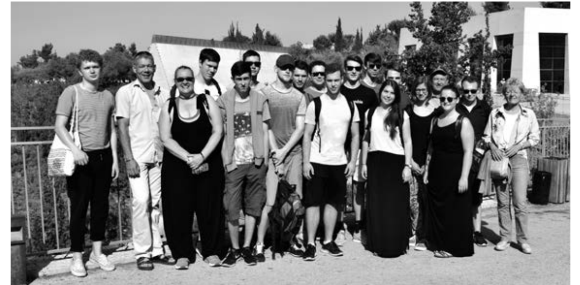
Die Reisegruppe der Berufsschule+ in Israel.

gen mit den Palästinensern scheiterten endgültig durch seine Ermordung. Der junge israelische Referent erarbeitete im Dialog die „roten und grünen Linien der israelischen Demokratie“. Das intensive politische Gespräch ergab Parallelen zum gleichzeitig in Hamburg ablaufenden G20-Gipfel.