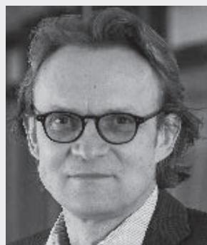
PROF. DR. KARL WILBERS

In meinem Beitrag im letzten Heft der vib-akzente habe ich sechs Gestaltungsfelder skizziert, die sich bei der Gestaltung des Übergangs einer beruflichen Schule in das 4.0-Zeitalter ergeben. Mit Blick auf die Fachtagung in Neusäß werden diese Felder kurz wiederholt und dann weiter in Leitfragen heruntergebrochen. Bei der digitalen Transformation beruflicher Schulen können die folgenden Gestaltungsfelder unterschieden werden.