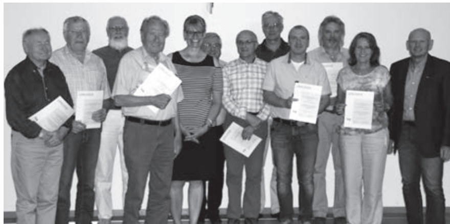
Bezirks- und Kreisvorsitzende freuen sich über langjährige Mitgliedschaften und danken den Geehrten für ihre Verbundenheit zum VLB.

ab dem fünfzigsten Lebensjahr. Über die Themen Erweiterung der Deutschkompetenz im Referendariat und das Problemfeld der Gleichbehandlung der jeweiligen Fachakademien für Ernährung und Sozialpädagogik konnten sich die Veranstaltungsteilnehmer ein ausführliches Bild machen. Eifrig diskutiert wurde die Entscheidung über die zeitliche Begrenzung der Seminarlehrertätigkeit für jüngere Seminarlehrer auf fünf Jahre. Die Bezirksvorsitzende schloss ihre Ausführungen mit dem Ausblick auf den vom Bezirksverband Schwaben zu organisierenden Berufsbildungskongress 2020 in Neu Ulm ab.