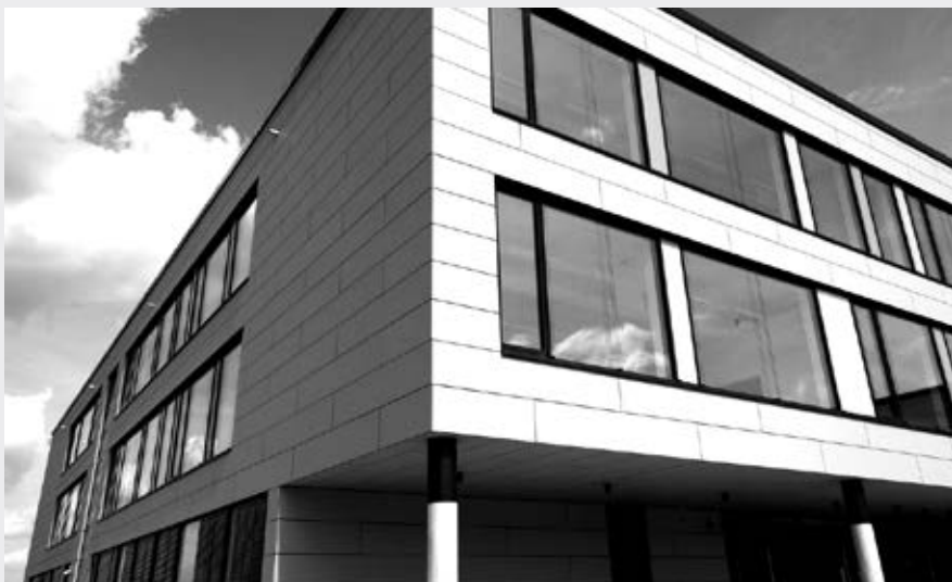
Das BSZ Neusäß erstrahlt im neuen Gewand.

Mit diesen baulichen Maßnahmen wurde ein Ort geschaffen, an dem junge Menschen ihre Begabungen und Talente noch besser entfalten können. Mit dem Neubau des Beruflichen Schulzentrums ist es gelungen, ein Schulhaus zu schaffen, das höchsten Ansprüchen an einen zeitgemäßen Lernort entspricht. Die Investiti-