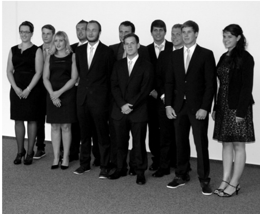
Sie können stolz auf das Erreichte sein: Die Absolventen des ersten Jahrganges der „Berufsschule plus“.