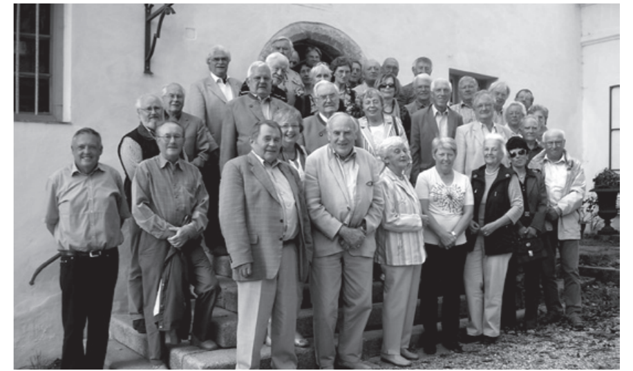
Die niederbayerischen Senioren vor dem Kloster Metten.

Von der ursprünglichen Kirche sind nur noch Reste der Fundamente erhalten. Die Abteikirche wurde im Laufe der Jahrhunderte mehrmals umgestaltet. Im 12. Jhd. errichtete man eine dreischiffige Basilika mit zwei Westtürmen und einer Vorhalle. Im 13. und 14. Jhd. erweiterte man den Bau durch Kapellen. Im gotischen Stil wurde die Abteikirche im 15. Jhd. umgebaut und in den Jahren 1712 – 1720 wurde sie barock umgestaltet. In der Kirche sind besonders die plastischen Stuckdekorationen, die Deckenfresken und das Altarbild sehenswert.