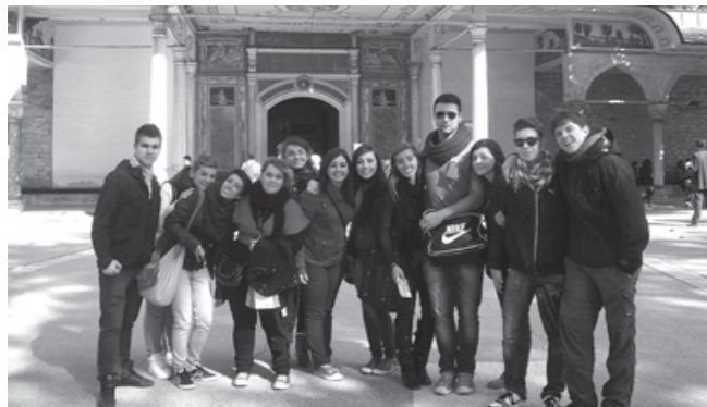
Im Palast des Sultans: Schüler aus Ungarn, Italien und Deutschland zu Gast in Istanbul.