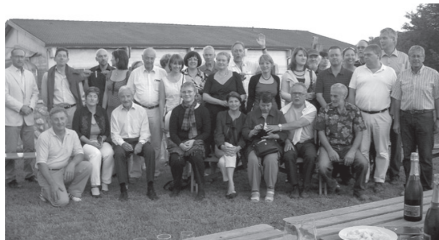
Die Münchener unterwegs.

Nach einer Weiterfahrt über Borghetto erreichten wir mit dem Bus die Gaststätte Trattoria al Fornello in Veggio. Ein ausgiebiges und vorzügliches Abendessen mit vielen italienischen Delikatessen – Vorspeisen, Hauptgericht, Nach-