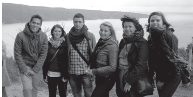
Schülertreffen in Istanbul: Sechs Fürther an der Bosphorus-Mündung ins Schwarze Meer

Schule Fürth an einem internationalen, von der EU geförderten Schulprojekt teilnimmt. So kamen neben der neunköpfigen Gruppe aus Fürth auch Delegationen aus Ungarn und Italien nach Istanbul, um am gemeinsamen Projektthema „Nachhaltiger Tourismus“ weiter zu arbeiten. Nicht immer einfach, eine solch bunte Mischung aus vier verschiedenen Sprachen und Kulturen. Doch wo