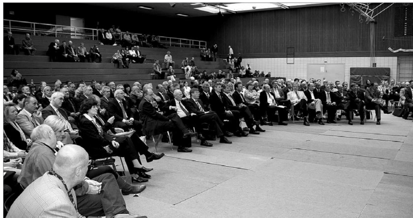
Die gut besuchte Festveranstaltung.