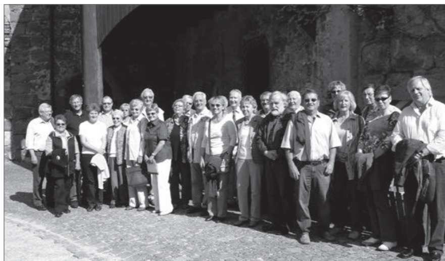
Kultur pur – die Nürnberger im Ritterschloss Burgthann.

Das Original des „Kegels“ kann im Germanischen Nationalmuseum in Nürnberg besichtigt werden.