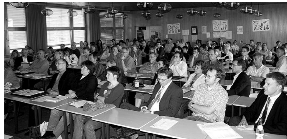
18 Arbeitskreise sorgten für die fachliche Information der Lehrkräfte – hier der Arbeitskreis Betriebswirtschaft.